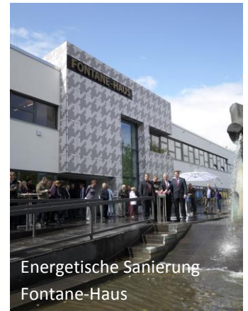
Energetische Sanierung Fontane-Haus

Der Stadtumbau wird parallel zu umfangreichen energetischen Modernisierungsmaßnahmen der GESOBAU AG, Haupteigentümerin im MV, durchgeführt.