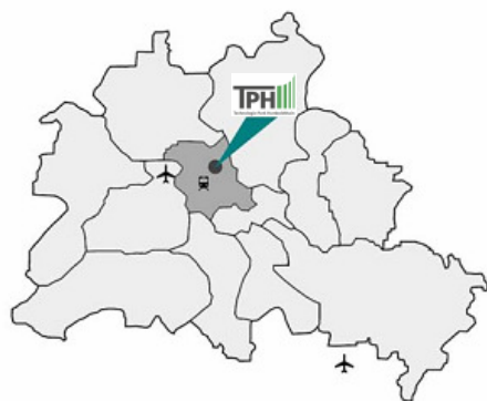
Zentrale Lage im Stadtraum