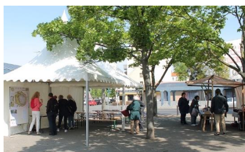
Infostände Umgestaltung Franz-Neumann-Platz, 2019