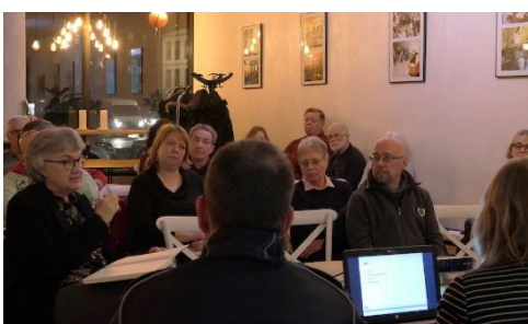
Gebietsgremium im März 2020